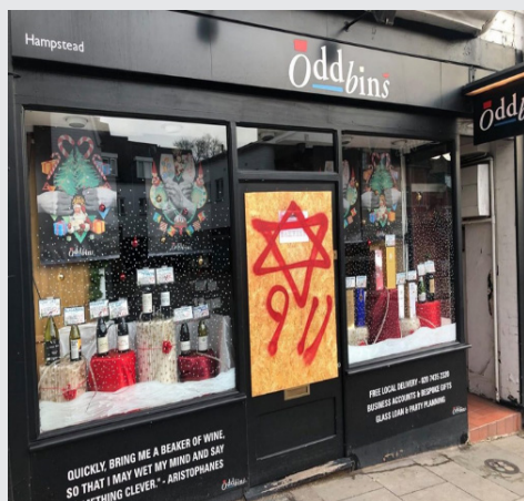
לונדון דצמבר 2019 (האשמת היהודים בפיגועי 11 בספטמבר 2001)