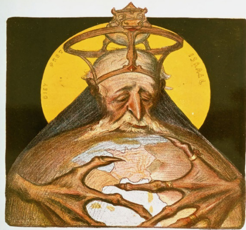
Rothschild Französische Karikatur von C. Léandre. 1898

מתוך עיתון צרפתי, תיאור של רוטשילד מחזיק את העולם בידיו