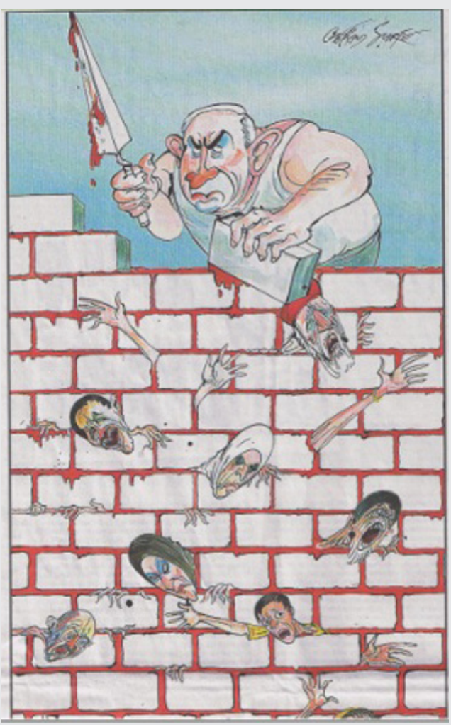
כאמור, הקריקטורה הופיעה בעתון סאנדי טיימס אוף לונדון בינואר 2013. העיתון התנצל לאחר פרסום הקריקטורה. התמונה לקוחה מתוך מאמר בנושא שפורסם בישראל בטיימס אוף ישראל, 3 בפברואר 2013.